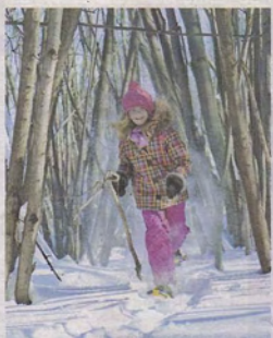
En raquettes, les circuits ne sont pas trop longs pour les enfants ayant déjà l'habitude de faire des randonnées.

En incluant d'autres sites comme le Bois Duverney, Laval pourrait détenir un réseau semblable. Reste à savoir jusqu'à quel point la spéculation ne sera un obstacle aux acquisitions de terrains que la Ville de Laval pourrait faire.